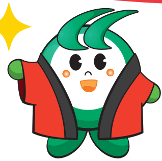
銚田市マスコットキャラクター ほこまる